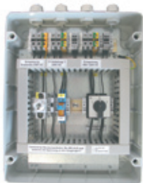
Bypass - BSV Kompakt